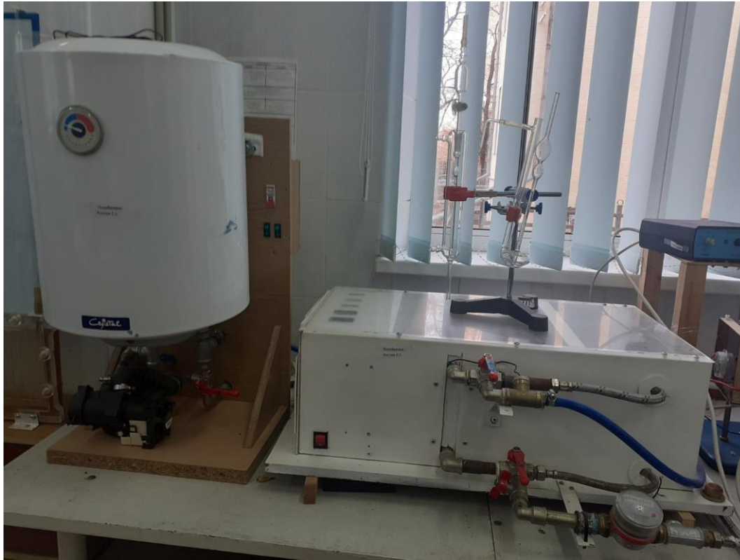
Установка по визначенню параметрів тепловіддачі оребрених поверхонь