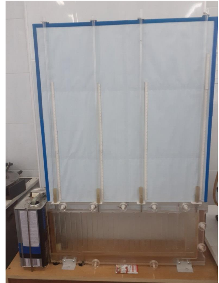
Установка по визначенню гідравлічного опору змійового каналу