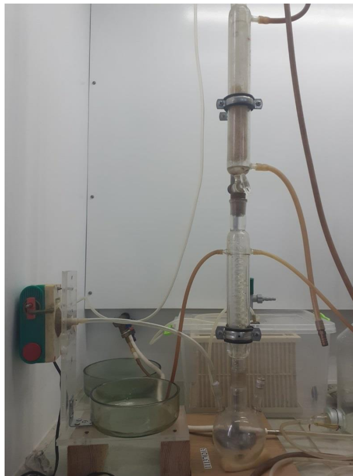
Установка для дослідження процесу теплообміну в теплообмінних апаратах типу «труба в трубі»