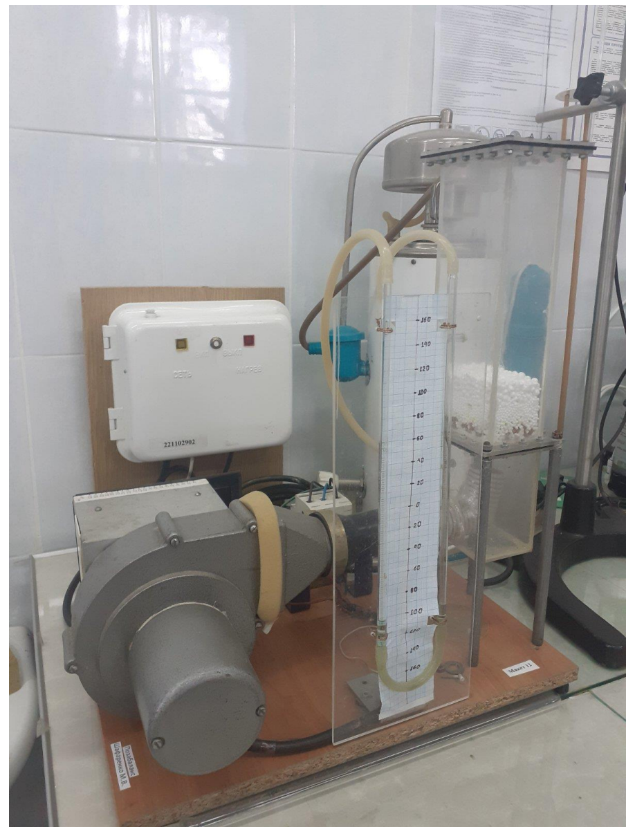
Установка для дослідження гідродинаміки киплячого (псевдозрідженого) зернистого шару