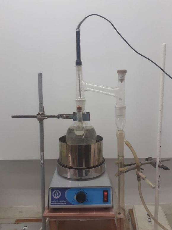
Установка для дослідження процесу випарювання