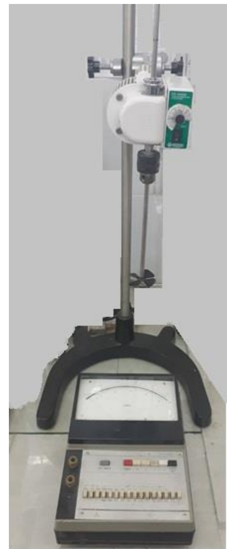
Установка для дослідження процесу перемішування в рідких середовищах