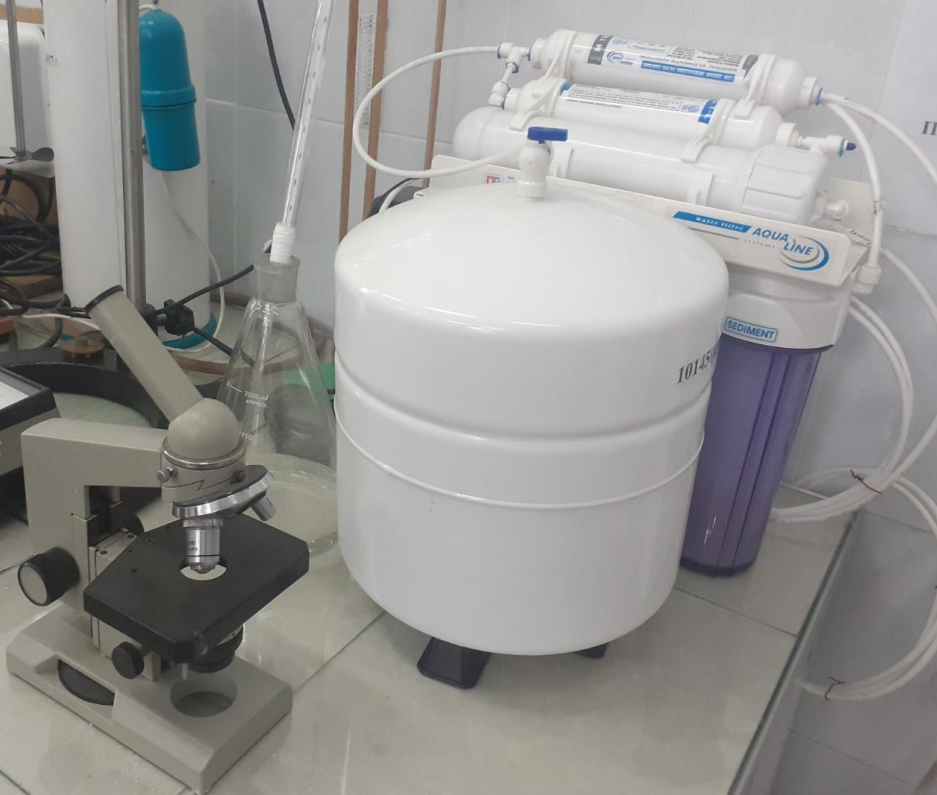
Установка для дослідження очищення води зворотнім осмосом